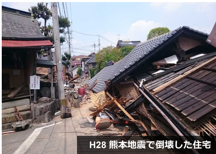
H28 熊本地震で倒壊した住宅