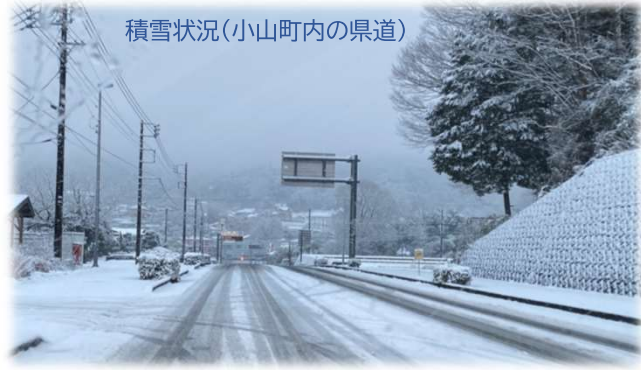
積雪状況(小山町内の県道)