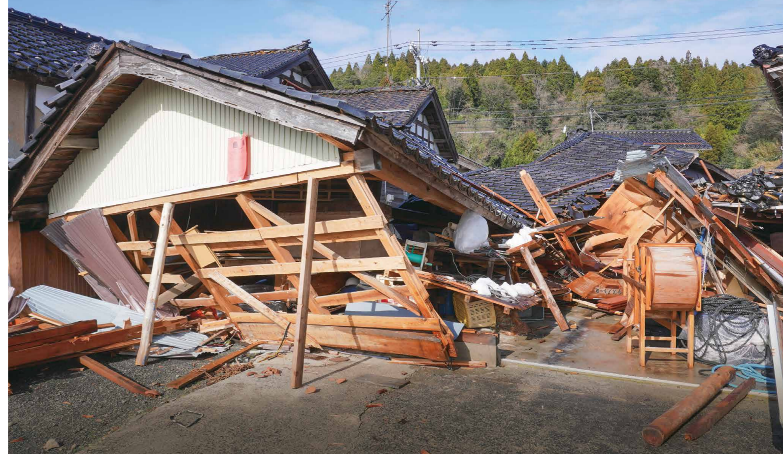
令和6年能登半島地震で倒壊した住宅