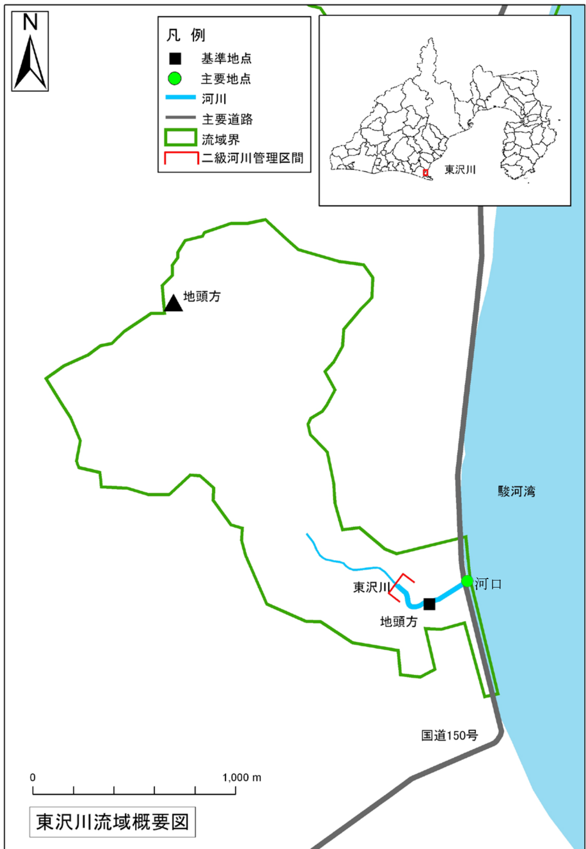
(参考図) 東沢川水系図