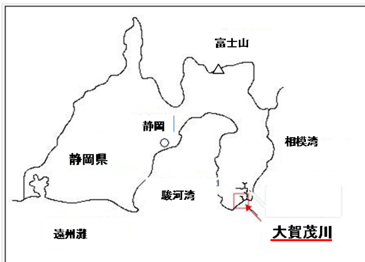
(参考図)大賀茂川水系図