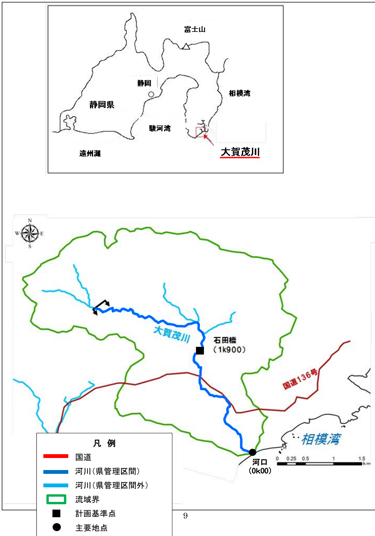
(参考図)大賀茂川水系図