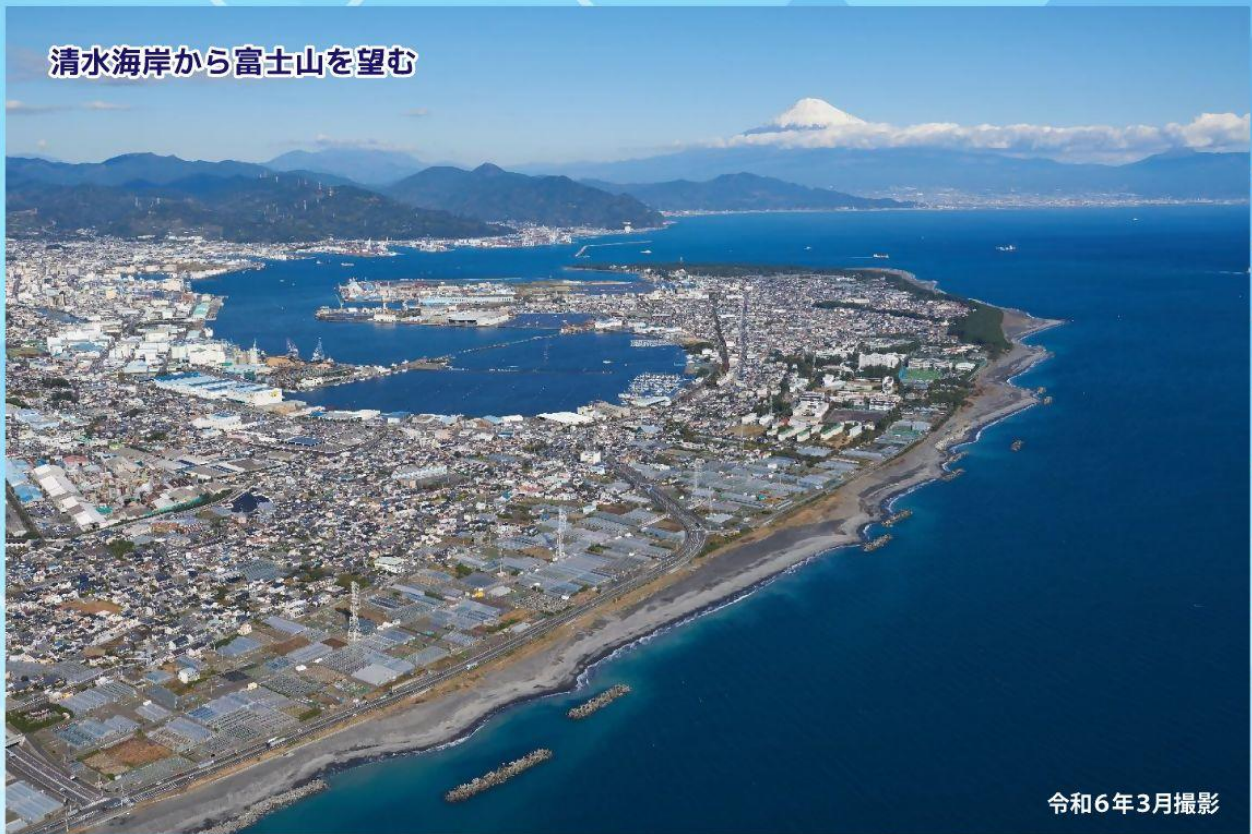
清水海岸から富士山を望む