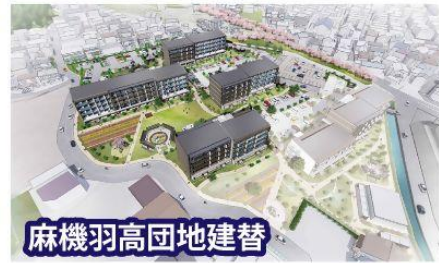
麻機羽高団地建替