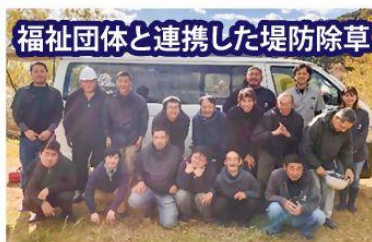
福祉団体と連携した堤防除草