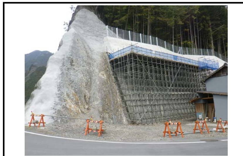
着 手 前