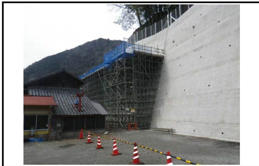
着 手 前