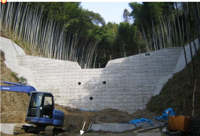
砂防堰堤（沢の谷沢）H22.3月末現在、工事中