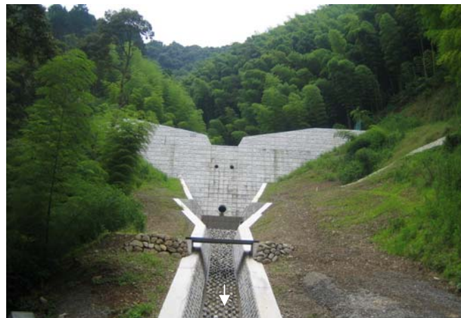
砂防堰堤（天白沢左支川）H21.6月30日完成