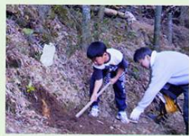
4月 竹の本数管理に繋がる たけのご掘り