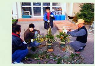
12月 門松・しめ縄づくり