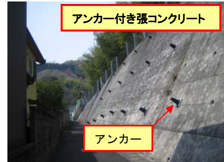
アンカー付き張コンクリート