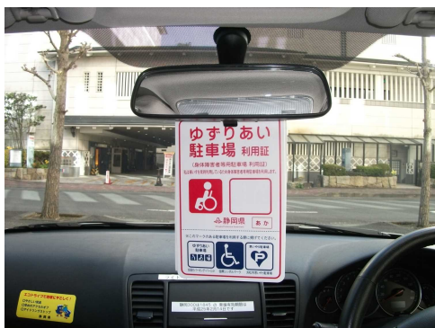
(利用証掲示のイメージ)