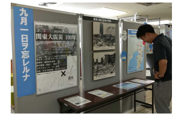
関東大震災100年 企画展

当時の教訓から防災意識を高めてもらうために、発生から100年を迎えた関東大震災、昭和5年に伊豆半島北部を震央として発生した北伊豆地震を紹介するSNS発信や企画展を行いました。