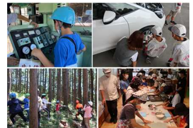
夏休みの自由研究体験講座

県内外に東部地域の魅力を知ってもらうため、東部地域で活躍するスポーツ選手等の発信力を活用した魅力発信を行いました。