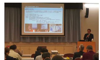
ふじのくに静岡県 伊豆・富士山周遊促進 連絡協議会(事業報告会)