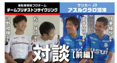
東部地域×スポーツ (対談企画)

東部地域の課題解決に向け、地域と連携した施策の企画及び推進のため、行政情報をはじめとした地域情報の収集と発信を行いました。