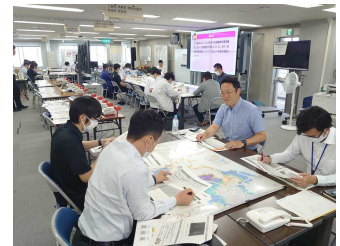
風水害対応イメージTEN研修

風水害に対する地域防災力の強化を図るため、管内市町職員、地域防災指導員及び自主防災組織役員に対して、風水害対応へのイメージトレーニングを実施しました。