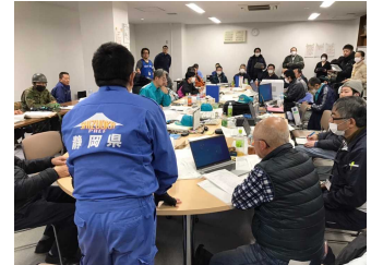
能登半島地震災害マネジメント支援チーム (町対策本部会議)

令和6年1月3日から、静岡県は石川県鳳珠郡穴水町(ほうすぐんあなみずまち)に当局職員を含めた支援チームを派遣し、町災害対策本部運営補助、避難所運営等の応援職員派遣に関する調整をしました。