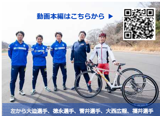
左から大迫選手、徳永選手、菅井選手、大西広報、福井選手