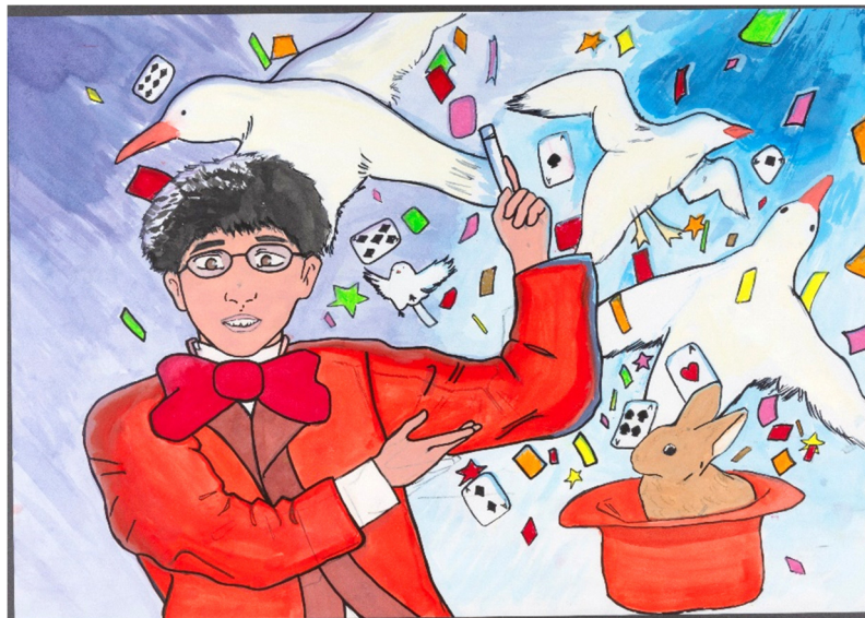
「将来の僕 マジシャン」