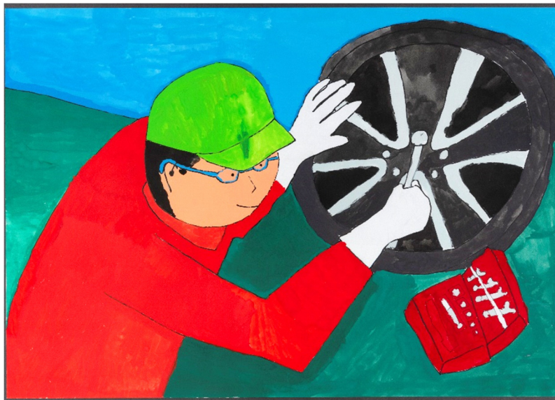
「車の点検をする整備士」