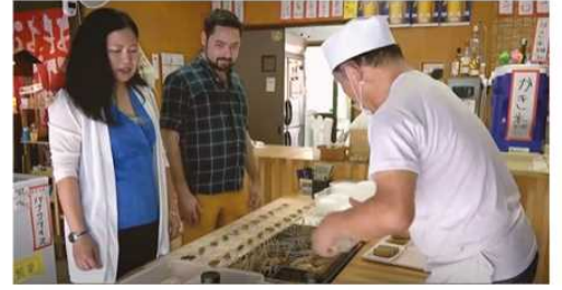
おもてなしの場面で↑