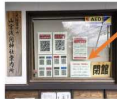
災害時の避難所で↑

はい 入ることは できません ころなういるす コロナウイルス (COVID-19) で びよきき ひと 病気の 人が 増えて います。 あいだ たてもの しばらくの間 この建物に はい 入ることは できません。