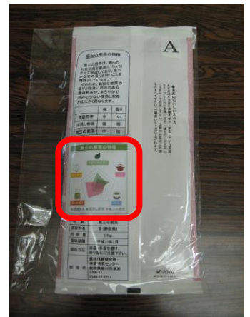
写真 調査に使用した茶袋