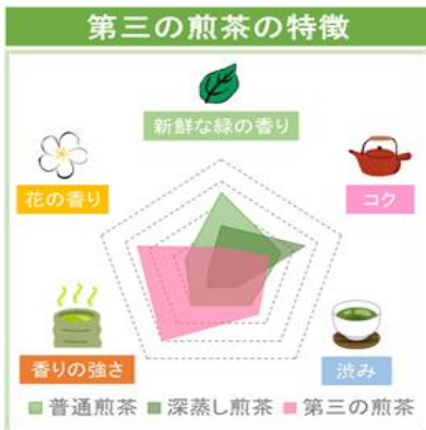
図1 A:レーダーチャートタイプ