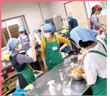
地域で支え合い活動する県内の子どもの居場所