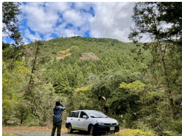
スギ林調査の様子