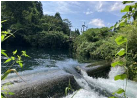
⑨ 猪之頭発電所（取水口・堰堤）