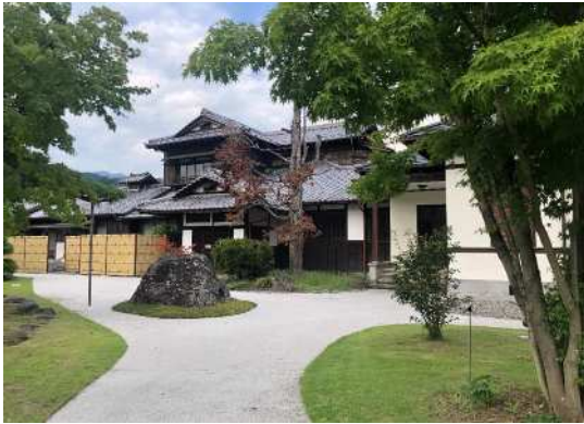
①豊門会館 和館・洋館