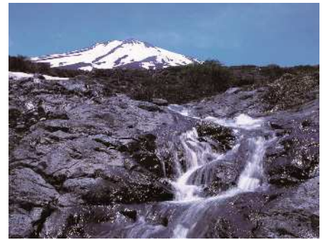
富士山の雪解け水

戦国時代以降、各地から富士山登拝者が訪れ、麓のまちは発展を遂げた。そして時代が移り、明治時代。日本は近代産業を移殖・振興し、急速に近代国家へ歩みを進めた。富士山登拝の拠点であった山麓のまち、現在の小山町と富士宮市は、富士山の恵みとともに、新たな時代への一步を踏み出した。