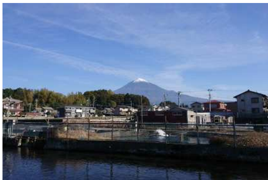
⑫ 山麓の水を利用した養鱒景観