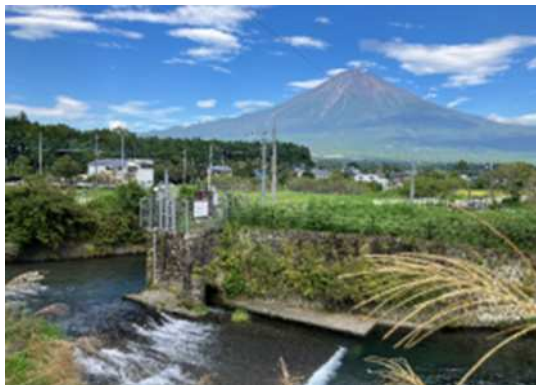
⑩ 白糸発電所（取水口・堰堤・水槽）