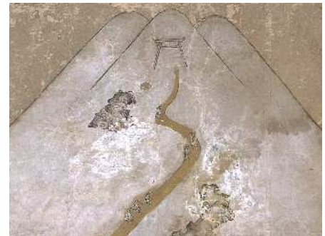
富士山の登拝

この成功は、同じく豊富な水を持つ東麓のまち-現小山町-を、工場誘致へと突き動かした。明治31年（1898年）、東京・横浜と鉄道（現東海道線御殿場線）で直結していた小山において、富士山と箱根山系の水が集まる鮎沢川（酒匂川の上流域）沿いで、水車動力の巨大な紡績工場、富士紡績会社小山工場が操業を始めた。この当時、鮎沢川の流れは、鉄道唱歌第1集13番に「いでてはくぐるトンネルの 前後は山北小山駅 今もわすれぬ鉄橋の 下ゆく水のおもしろさ」とうたわれるほど印象的であった。