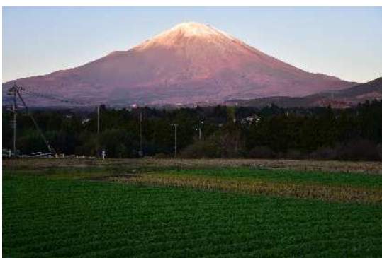
⑪ 小山の水かけ菜栽培景観