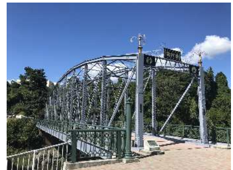
鮎沢川に架かる森村橋