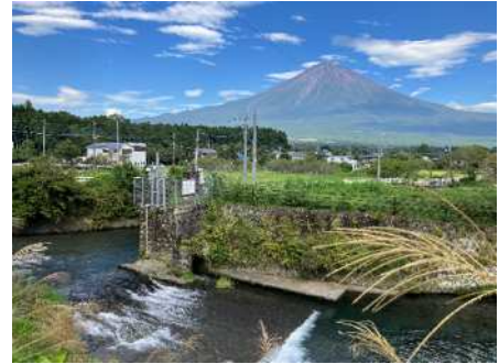
現在も稼働する発電施設

同じ頃、富士山を隔てた西側、現在の富士宮市でも電力化の動きに呼応していた。水力発電は、芝川沿いが舞台となった。明治43年(1910)の発電所建設を嚆矢に、昭和初期までに15か所で水力発電所が芝川沿いに造られた。