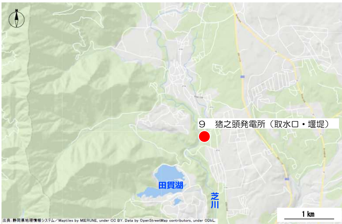
拡大図 2 (富士宮市①)