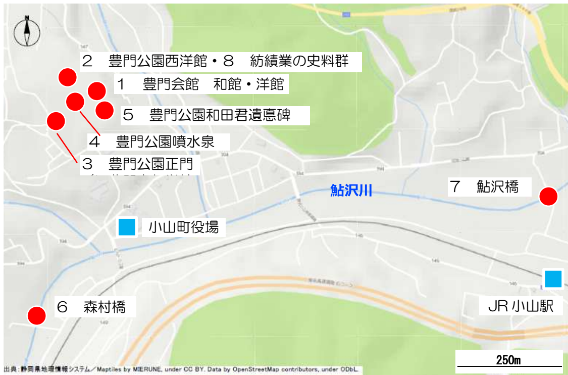
拡大図 1 (小山町)