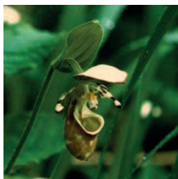
キバナアツモリスウ