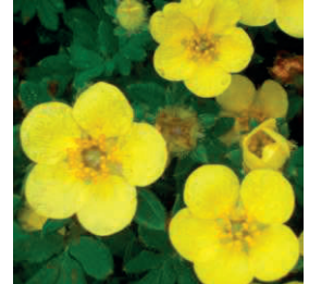
キンロバイ(ハクロバイを含む)