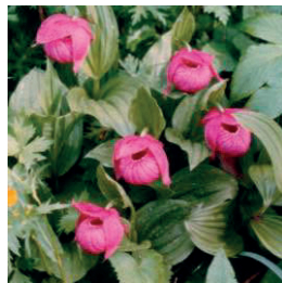
ホテイツモリスウ