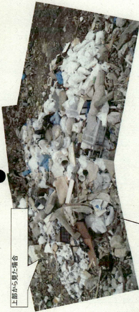
上部から見た場合