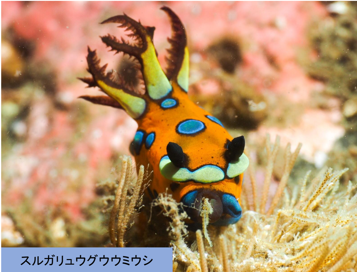
スルガリュウグウウミウシ