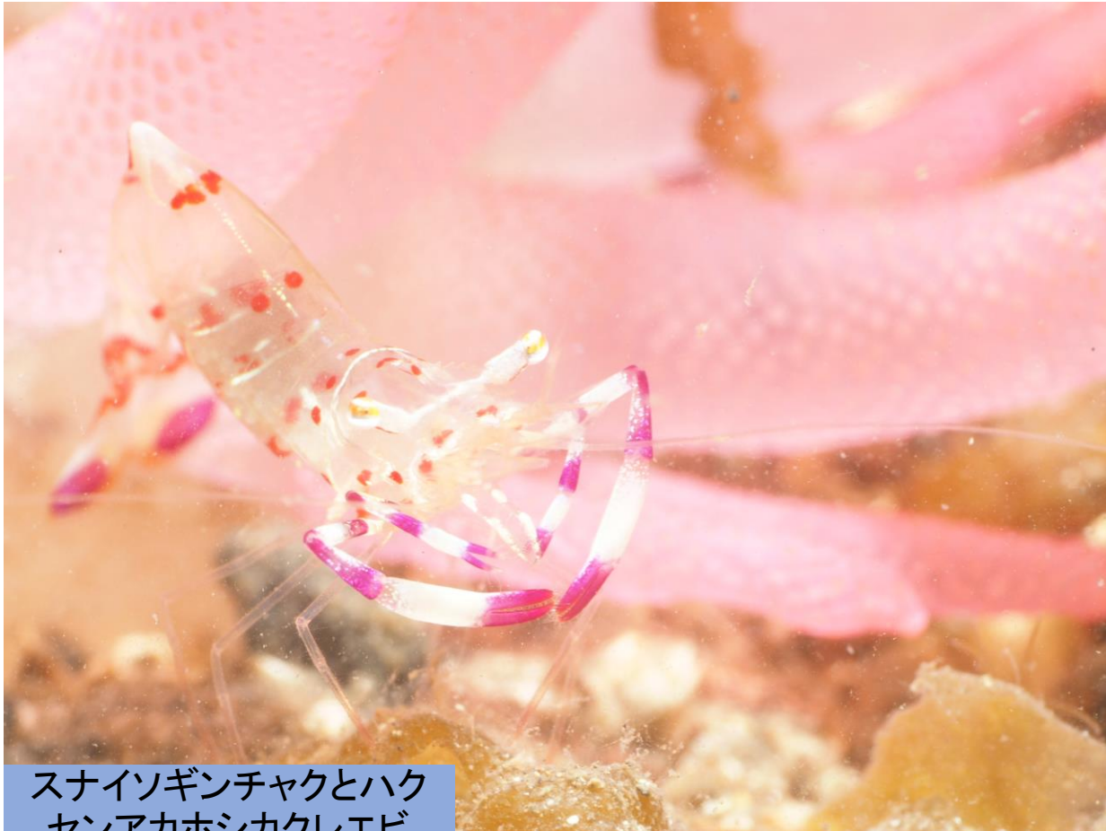
スナイソギンチャクとハクセンアカホシカクレエビ