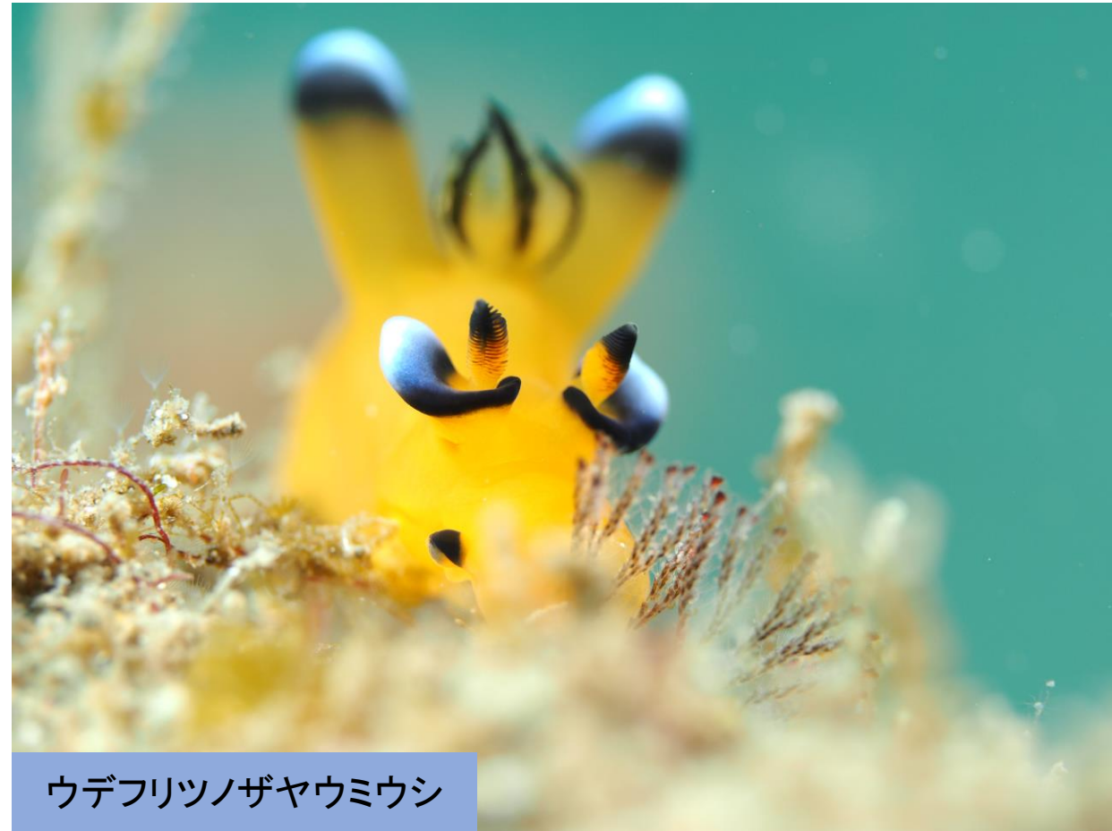
ウデフリツノザヤウミウシ