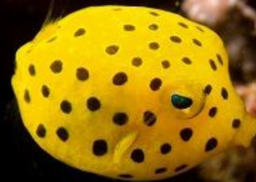
ミナミハコフグ(幼魚)