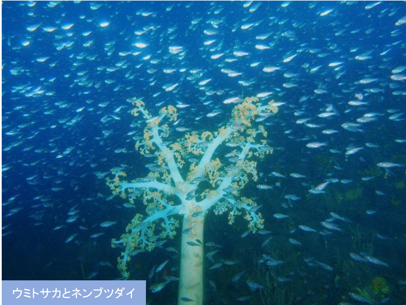
ウミトサカとネンブツダイ