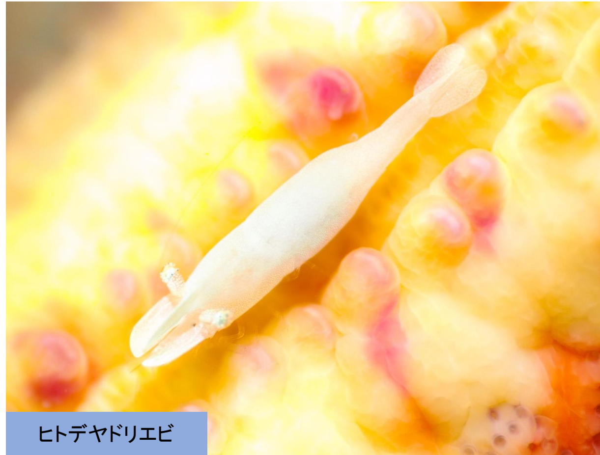
ヒトデヤドリエビ