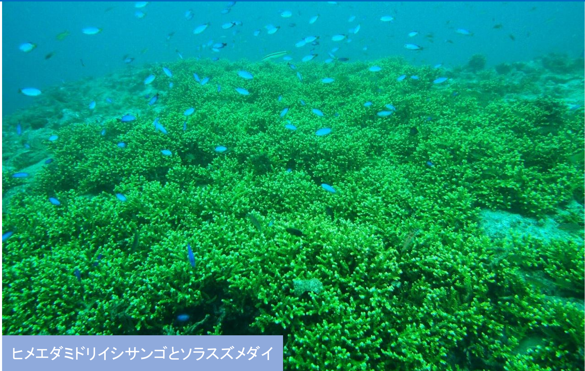
ヒメエダミドリイシサンゴとソラスズメダイ