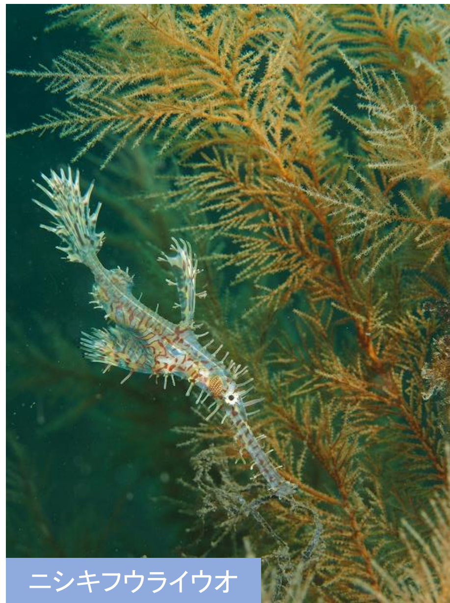
ニシキフウライウオ