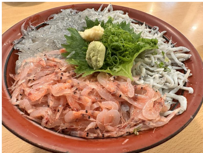
サクラエビとシラス