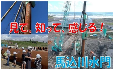
「見て、知って、感じる 馬込川水門」