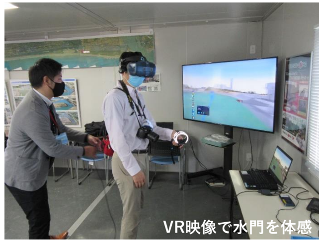
VR映像で水門を体感

見学は 事前予約制（平日のみ） です。対象は 浜松市内にお住まいの10名以上の団体 で、個人では受付しておりません。※通常は閉館しておりますのでご注意ください。