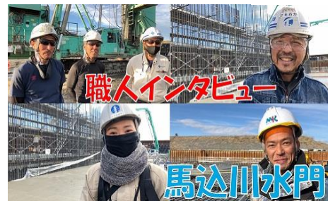
「職人インタビュー 馬込川水門で働く人たちの魅力」