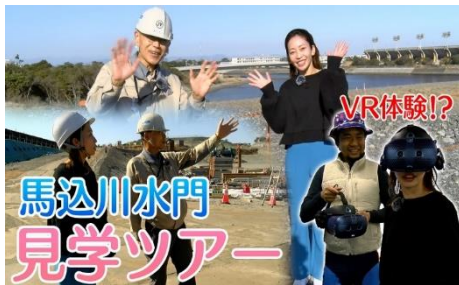
「馬込川水門見学ツアー 土木インフラの魅力をお伝えします。」