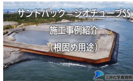
「川を締め切り、波にも耐える仮締切とジオチューブ」