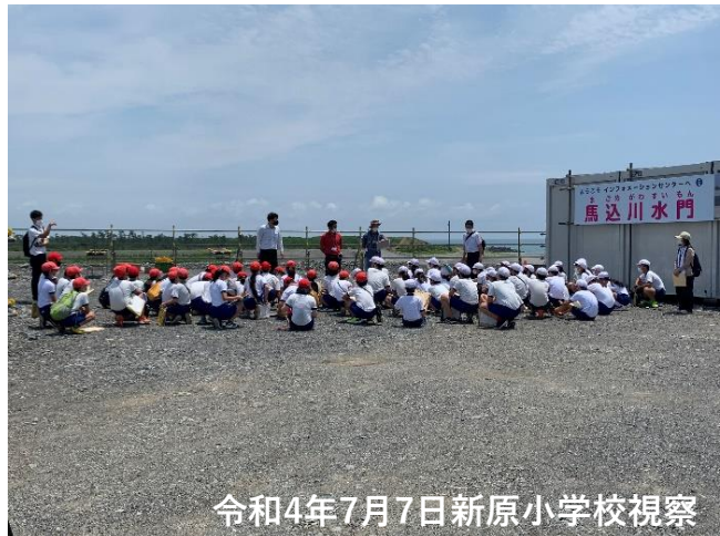
令和4年7月7日新原小学校視察

令和4年度、馬込川水門インフォメーションセンターには、約1,000人の方に来場いただきました。水門建設事業への理解を深めていただく場となっております。多くの皆様のご来場をお待ちしております。