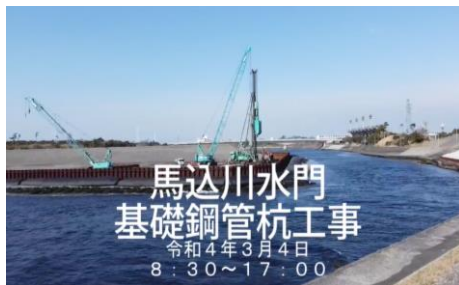
「基礎の鋼管杭の打ち込み工程を紹介！」