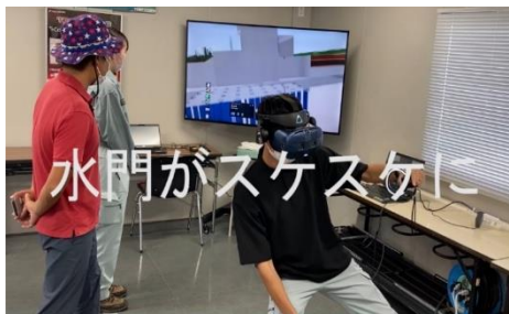
「馬込川水門チャンネル始めます。VRとARで水門にGO」