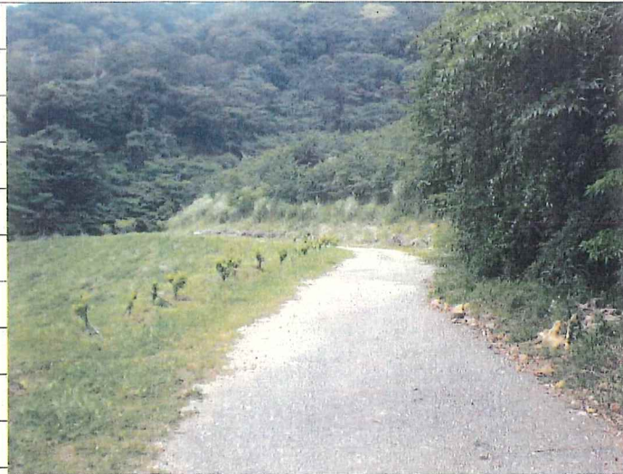
② [Redacted] (熱海市伊豆山赤井谷残土処分場)