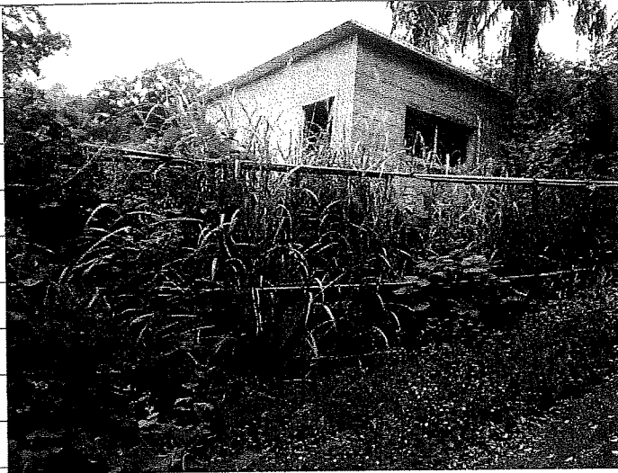
② [Redacted] (熱海市日金町)