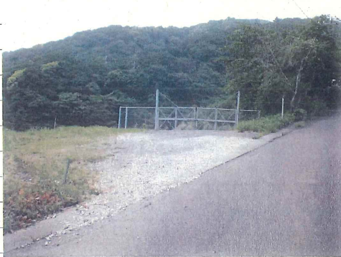
① [Redacted] (熱海市伊豆山赤井谷残土処分場)