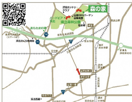
静岡県立森林公園 森の家