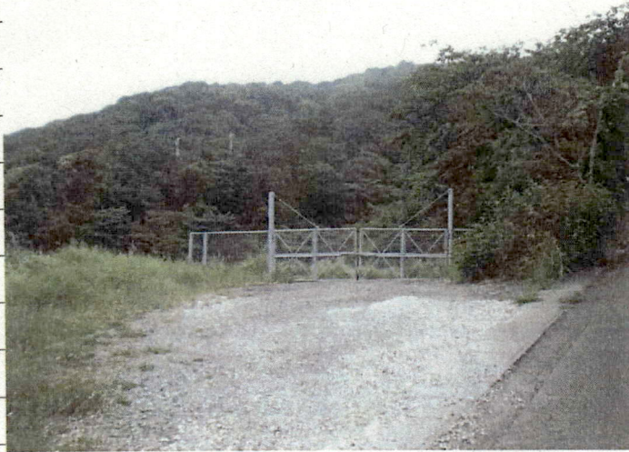
① [Redacted] (熱海市伊豆山赤井谷残土処分場)