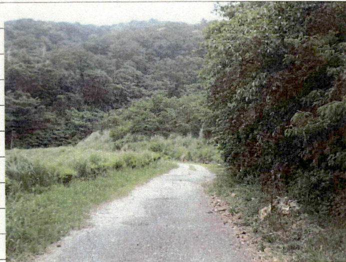
② [Redacted] (熱海市伊豆山赤井谷残土処分場)