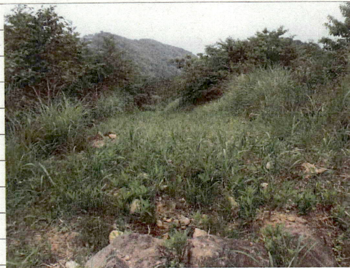
② [Redacted] (熱海市伊豆山)