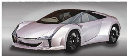
ナノセルロースヴィークル 環境省