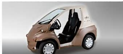
もくまる トヨタ車体株式会社