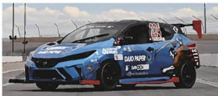
SAMURAI SPEED 大王製紙株式会社