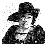
三浦 環 (みうら たまき)

静岡国際オペラコンクールは、静岡県ゆかりのプリマドンナ三浦環をたたえ、没後50年にあたる1996年から3年ごとに浜松で開催されています。予備審査を経て参加が認められた世界の若手オペラ歌手たちが得意なアリアを歌うほか、オペラの一役を演じその歌唱力と表現力を競い合います。