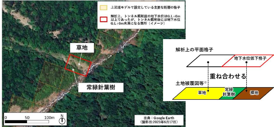
草地や湿地を抽出する方法のイメージ

○トンネル掘削により地下水位が低下した場合の、「植生への影響の最大量」を想定した。