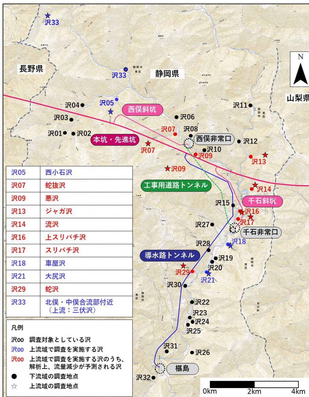
図 1 調査位置図 2