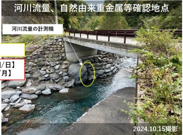
図 2 西俣ヤード周辺における自然由来重金属等に係るモニタリング計画