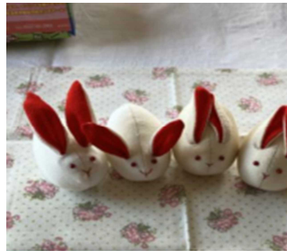
雛のつるし飾り制作体験