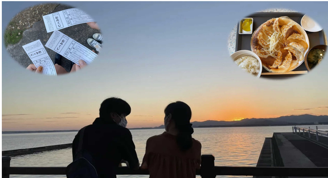
浜松市「秋」の魅力【館山寺】

これからも、高校生の目線で、地元浜松を観光の側面から盛り上げていきたいと考えています。