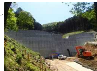
不透過型堰堤(参考)