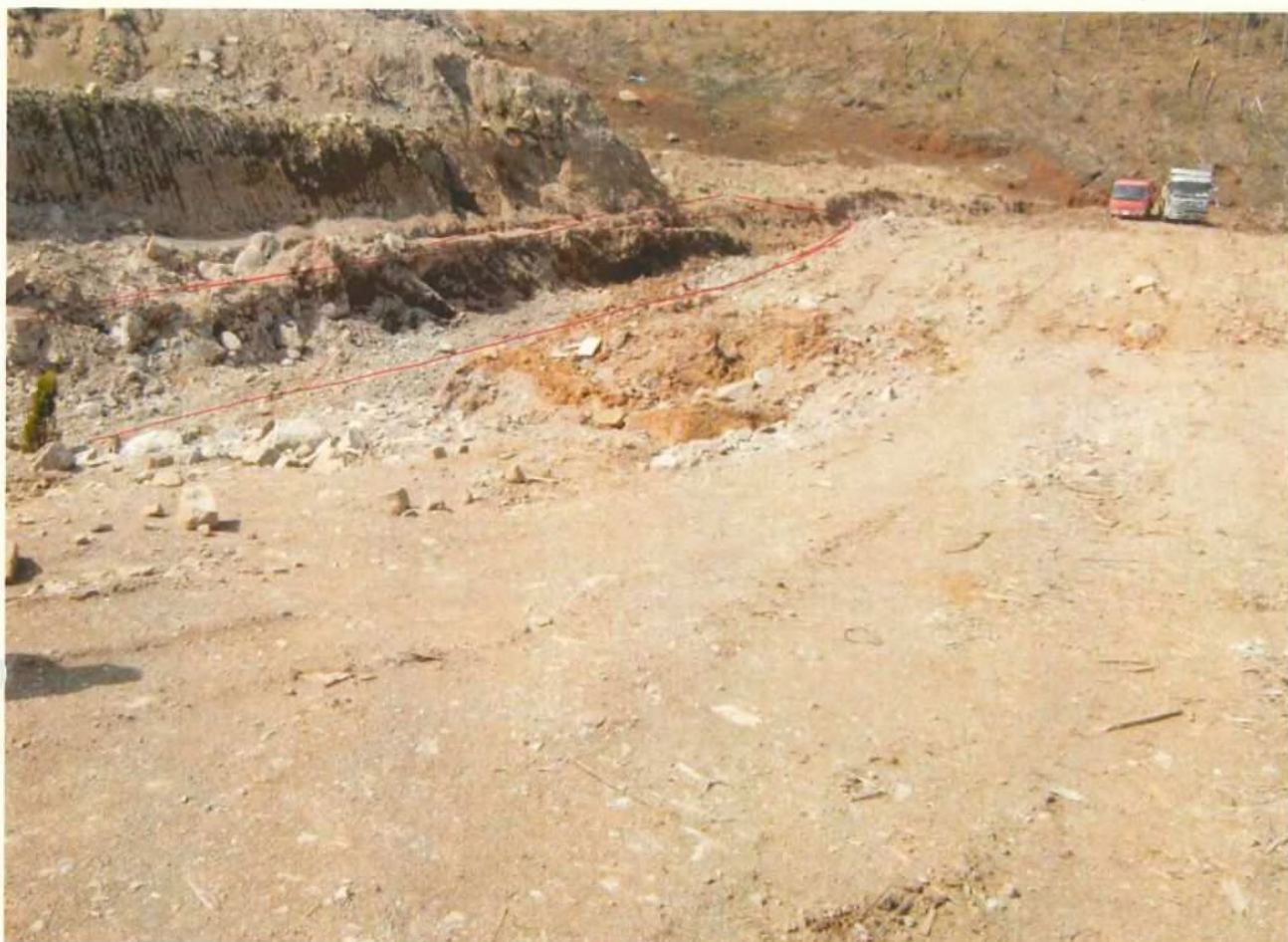
H20. 12.24 確記: 仮設沈砂池形状準備!