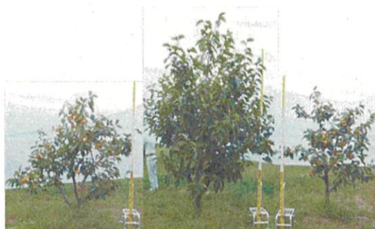
14 年生「前川次郎」の生育（左：静カ台 1 号 中：市販ヤマガキ台 右：静カ台 2 号）