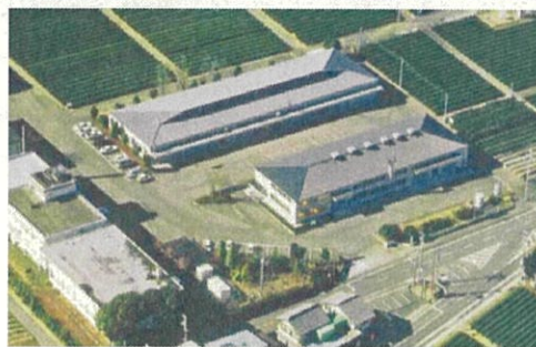
茶業研究センター

緑茶価格の低迷など、厳しい状況が続いていますが、茶業研究センターでは、茶の生産に係る新技術開発や低コスト・省力栽培加工技術研究等と併せて、消費者の期待に応えられる付加価値の高いお茶の研究開発に取り組み、多様な静岡茶の生産拡大に貢献してまいります。