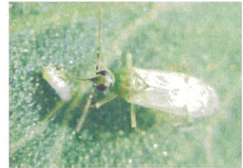
タバココナジラミを捕食するタバコカスミカメ