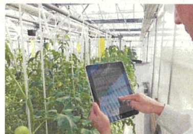
トマトのICT活用技術