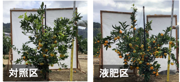
図 液肥施用の有無による地上部の生育の違い

液肥を施用するため資材費が対照区と比べ多くかかりますが、初期収量が増加するため収穫開始2～3年後には資材費の回収が期待されます。