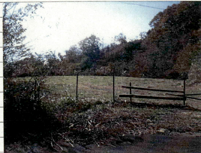
② [Redacted] (熱海市伊豆山)