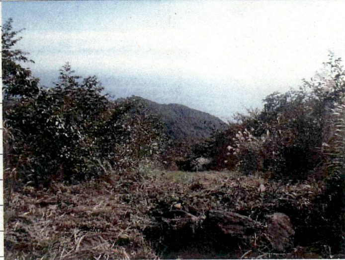
① [Redacted] (熱海市伊豆山)