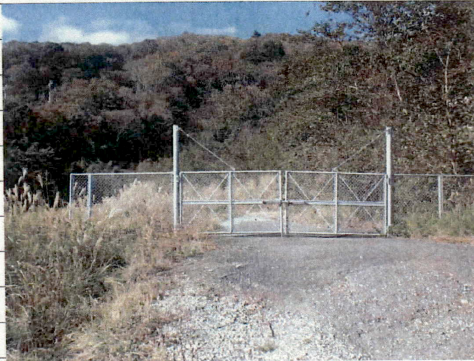
① [Redacted] (熱海市伊豆山赤井谷残土処分場)