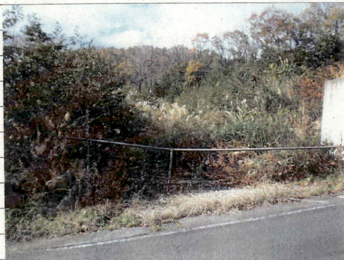
① [Redacted] (熱海市日金町)