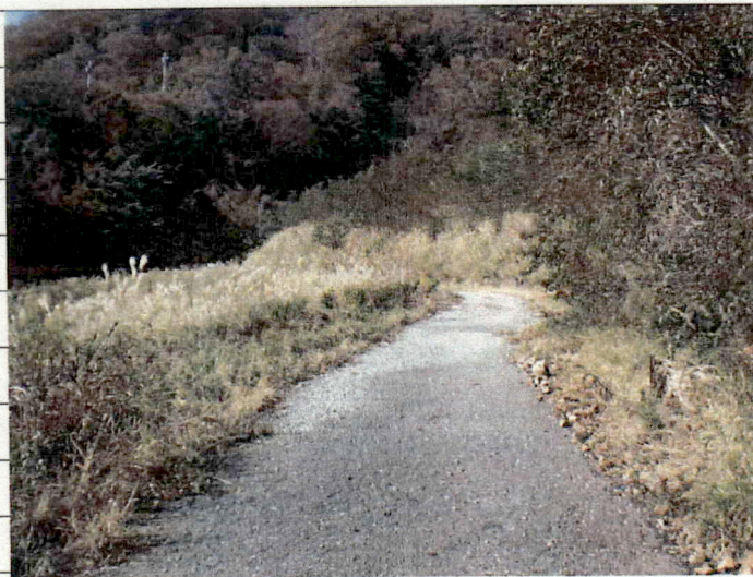
② [Redacted] (熱海市伊豆山赤井谷残土処分場)