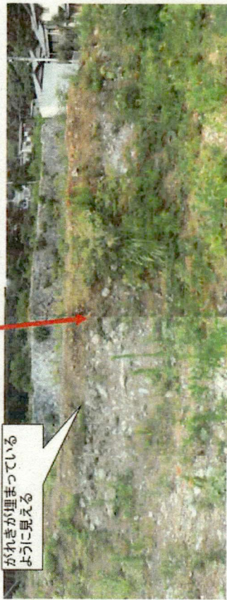
日金町不適正現場