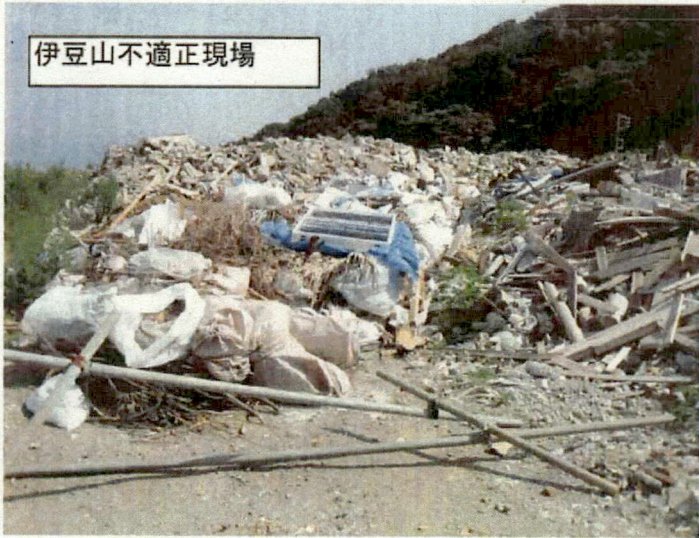
伊豆山不適正現場