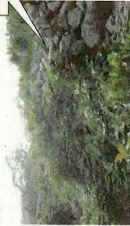
草が多く茂るが、変化はなし