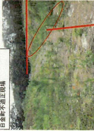
日金町不適正現場