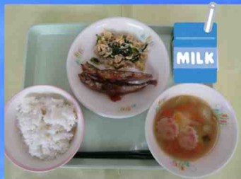
裾野市学校給食施設再編整備事業 (裾野市)

裾野市では、給食施設・設備の老朽化状況等を総合的に考慮し、自校式給食施設から学校給食センターへの集約を進めるにあたり、事業者様が有する柔軟なアイデアを元に整備方針や手法等幅広い視点で検討を行います。