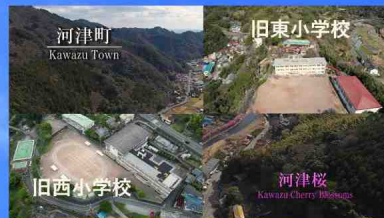
旧河津町立西小学校・東小学校 利活用について(河津町)

令和5年4月より町内3小学校が統合され閉校となった「旧西小学校」「旧東小学校」について利活用を検討中です。自然資源の豊富な環境を活かした、雇用の創出を図る新たな活用策などの、御意見や御提案を募集します。