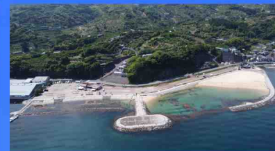
沼津市西浦海浜施設(らららサン ビーチ)の利活用事業(沼津市)

「らららサンビーチ」は、海辺の憩いの空間として、夏期には海水浴場として多くの利用者を集めています。本施設の夏期以外の利活用、「海業」を活用した事業など、施設や周辺地域の持つポテンシャルを活かすためのアイデアを募集します。