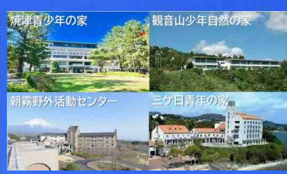
県立青少年教育施設の利活用について (静岡県)

静岡県教育委員会では少子化の進行等の社会変化により、青少年教育施設のあり方を検討しています。少子化による利用者数の減少や施設の老朽化も踏まえ、青少年教育施設の利活用方法や適正な施設運営についてご意見・ご提案を募集します。