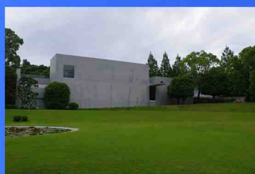
ヴァンジ彫刻庭園美術館跡地の利活用 について(静岡県)

長泉町の民間美術館(令和5年9月末閉館)の建物及び土地の寄附を受け入れ、県の文化施設として活用する予定です。本施設での官民連携手法導入の可能性や、収益向上のための導入機能などについて、広く御意見・御提案を募集します。