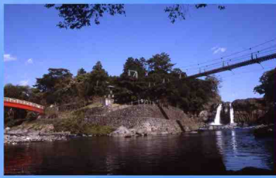
裾野市中央公園再整備事業 (裾野市)

観光施設を有する本公園を、カフェ等を取り入れた魅力ある公園に再生整備することを検討しています。観光バス等も立寄る公園なので、市民はもとより来園者の滞在時間が長くなる公園とし、将来的には維持管理も含めた持続可能な公園の運営を考えています。