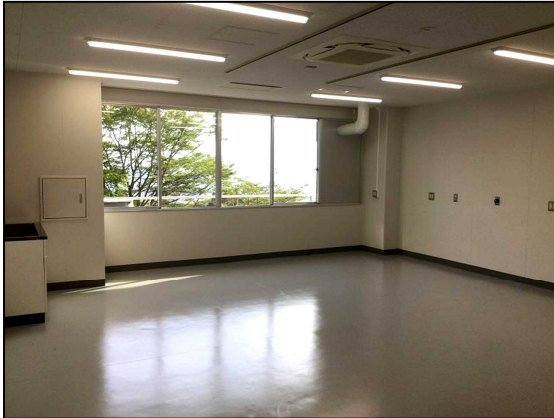
窓側 (入口から撮影)