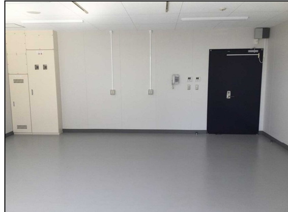
入口側 (窓側から撮影)