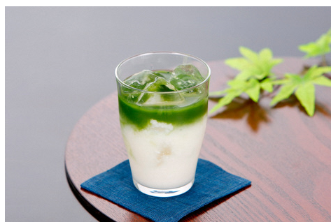
油山寺「冷やし緑茶甘酒」