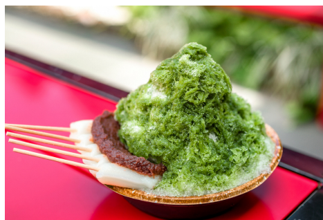
法多山「厄除氷（かき氷）」

この祭りのもう1つの楽しみが、各寺院で提供される夏のスイーツです。法多山では、名物の厄除だんごが添えられた「厄除氷（かき氷）」が絶品。可睡齋では伝統的な「水無月ぜんざい」。油山寺では「冷やし緑茶甘酒」など、この時期だけの涼味を堪能できます。