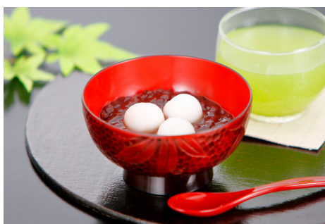
可睡齋「水無月ぜんざい」