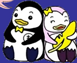
更生保護のマスコットキャラクター 「更生ペンギンのホゴちゃんとサラちゃん」