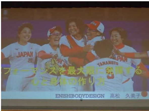
講演会のスライド①