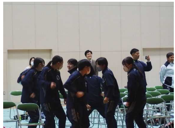
↑参加者全員が「全カジャンケン」で盛り上がる↑