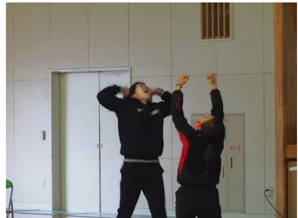
全カジャンケンの実演