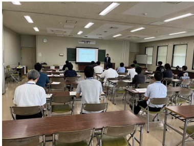
専門講師による講義

その他にも、 農業者の仲間を作りたい方 や 最新の農業トピックス について知りたい方にもオススメ！ お気軽にお申し込みください！