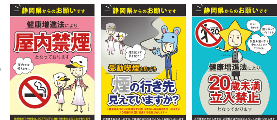
受動喫煙防止デザイン

掲示用ステッカーのデータは静岡県のホームページから無料でダウンロードできます。→ で検索