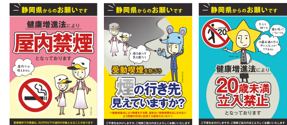
受動喫煙防止デザイン

掲示用ステッカーのデータは静岡県のホームページから無料でダウンロードできます。→ で検索