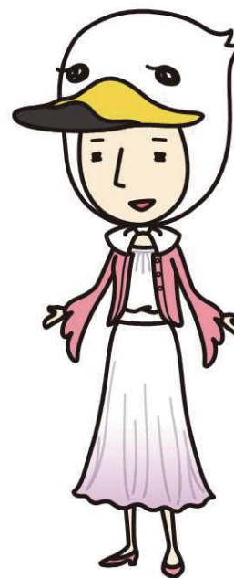
スワンさん 静岡県受動喫煙防止対策 キャラクター