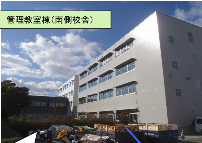
管理教室棟(南側校舎)