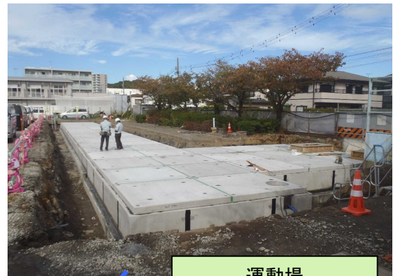
運動場 (雨水用地下貯留槽の設置)