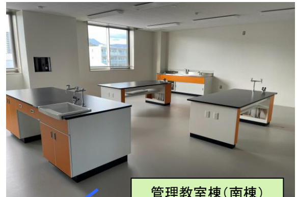
管理教室棟(南棟) 3F 理科室

北側校舎です。知的教育部門の教室です。ホワイトボードやロッカーが整備されています。