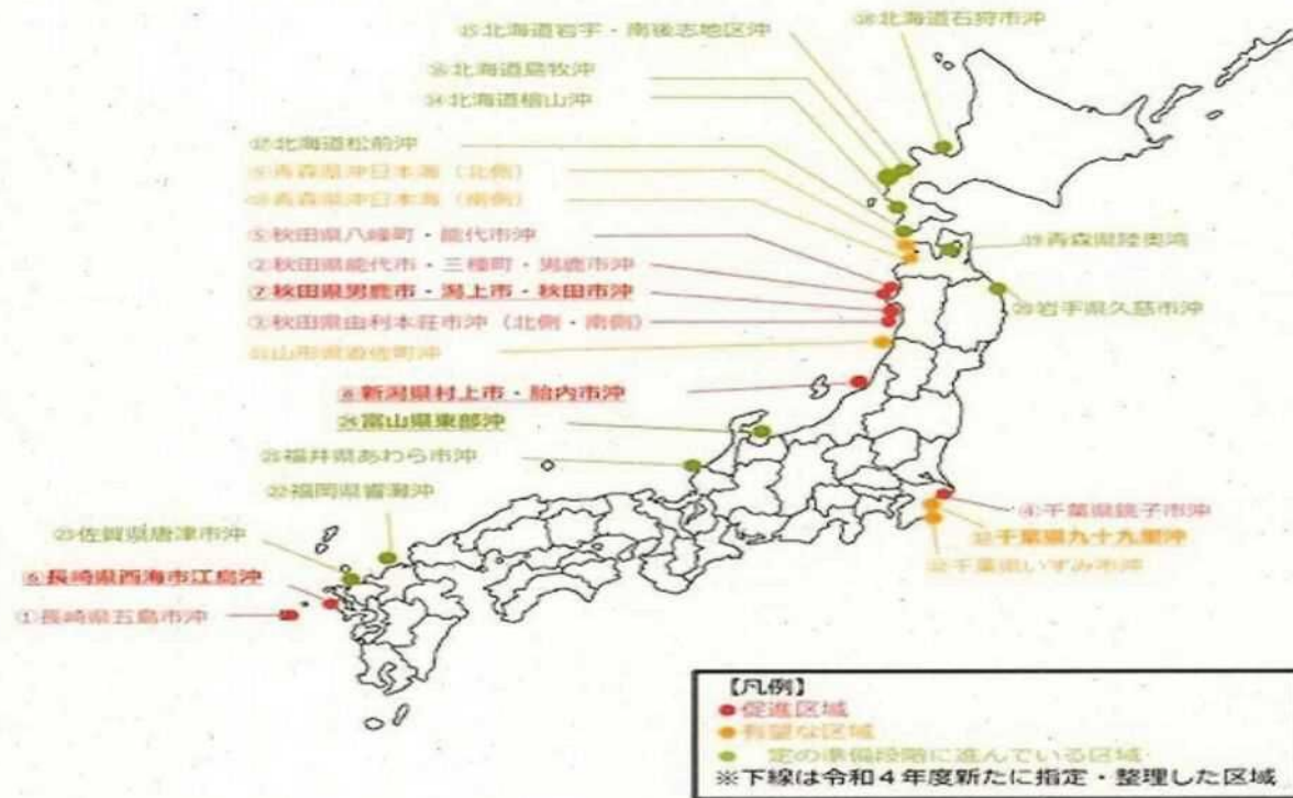
促進区域、有望な区域等の指定・整理状況 (2022年9月30日)